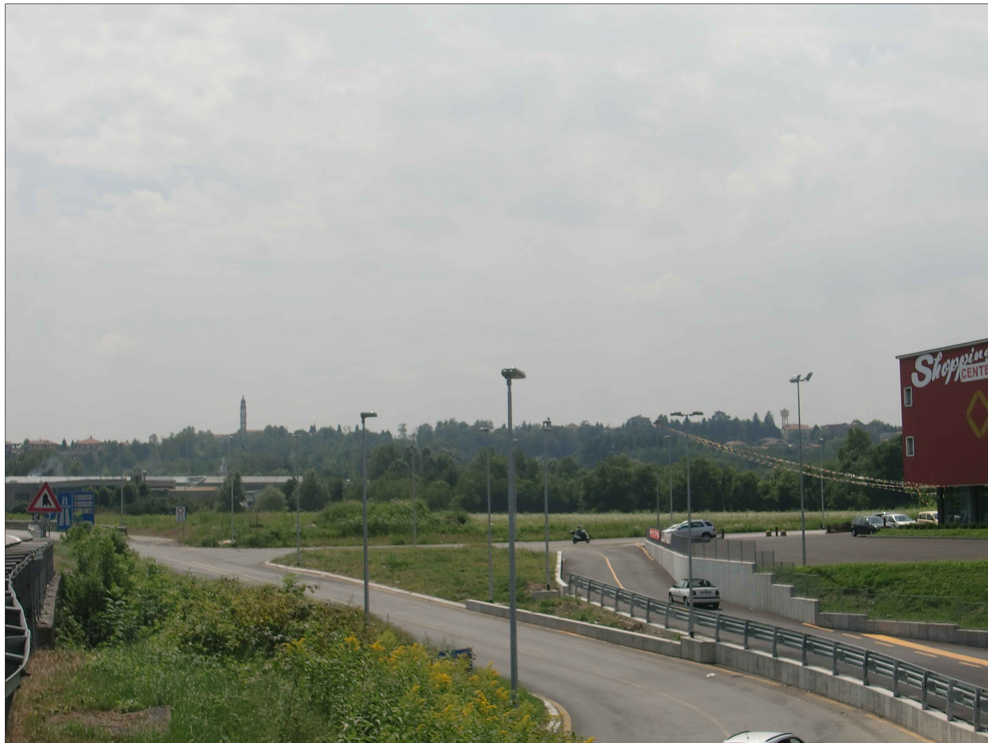
FOTOGRAFIA - STATO ATTUALE -